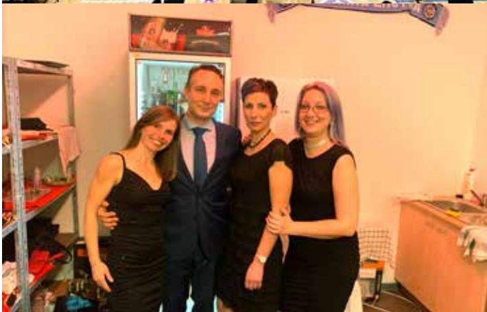
Hala připravená na sportovní ples a momentka ze zákulisí