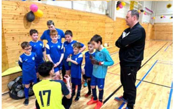
Po perné přípravě a taktických radách se klukům v hale dařilo